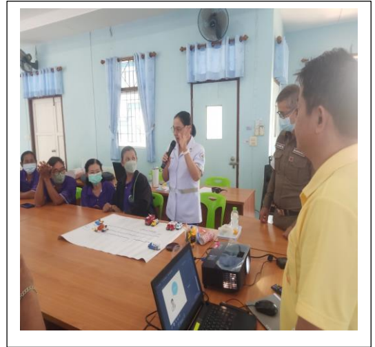
บรรยายให้ความรู้ ซ้อมแผน รับมืออุบัติเหตุน โตะ