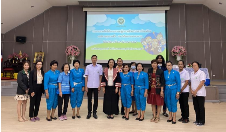
ชมรมผู้สูงอายุตำบลท่าโพ ชมรมผู้สูงอายุต้นแบบ

-การดูแลสุขภาพด้วยแพทย์ผสมผสาน /นั่งสมาธิ SKT