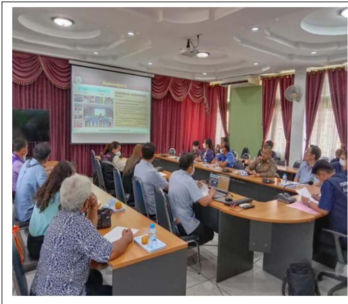
นายอำเภอหนองขาหย่าง กล่าวเปิดการประชุม